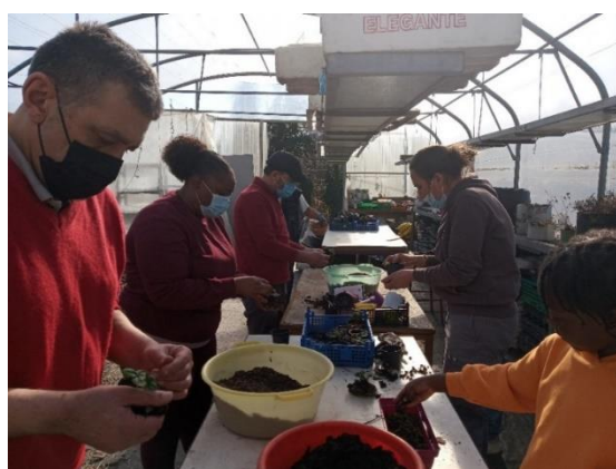
Atelier semis avec un autre service de l'Association, « Les Marmites » Mars 2022.

L'insertion professionnelle reste compliquée pour une part de notre public trop éloigné de l'emploi, trop marginalisé. Pour ce public, notre objectif sera davantage de les aider à sortir de l'inactivité, de conduites addictives et de les orienter par la suite si possible vers du bénévolat ou des activités en centre socioculturel.