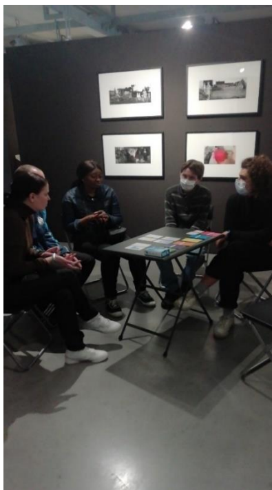
Atelier photo et visite médiatisées

visites d'expositions, 6 sorties « découvertes de lieux culturels/de socialisation », 10 rencontres festives/moments de convivialité, 4 sorties nature et 1 chantier participatif.