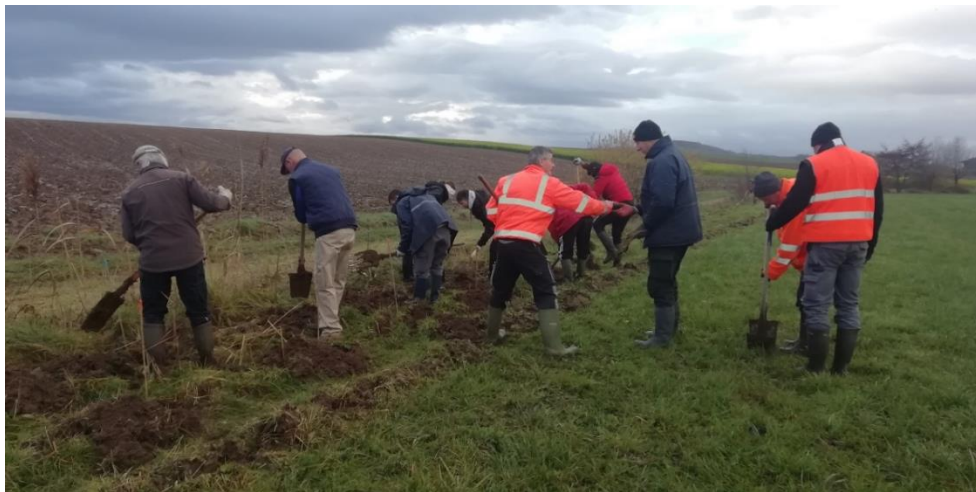
Chantier Participatif avec Haies Vives d'Alsace en décembre 2022